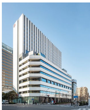
「横浜東急 REI ホテル」 外観イメージ