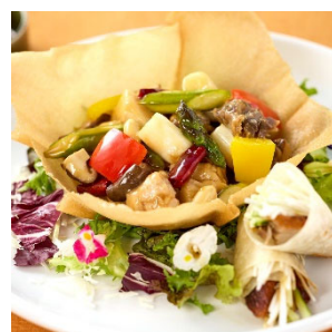
3月「北京風 宮保鶏丁～北京ダック添え～」イメージ

さらに、サラダ・スープ・デザートなどはbuffetスタイルでお楽しみいただけるほか、ランチタイム終了まで時間制限なくご利用いただける、大変お得なランチセットです。カジュアルで落ち着いた雰囲気の店内で、時間を気にせず、心ゆくまで中国料理の魅力をご堪能ください。