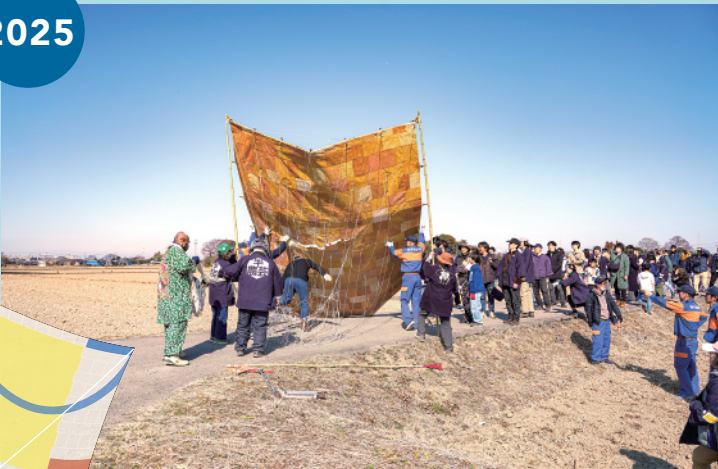
2025年2月1日の凧揚げを終えた直後の十二畳凧