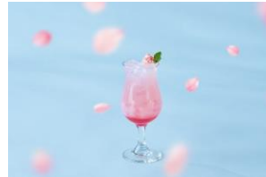
SAKURAスパークル 1,100円 (税込)