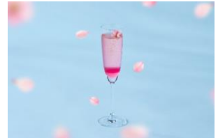
SAKURAブロッサム 1,210円 (税込) ※アルコールドリンク