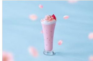
SAKURAストロベリー ロイヤルミルクティー (ICE) 1,100円 (税込)