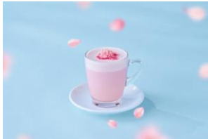
SAKURAストロベリー ロイヤルミルクティー (HOT) 1,100円 (税込)

桜色の彩りと春の高揚感をグラスに映した、季節限定のドリンク4種が登場します。アニヴェルセルオリジナルのロマンスティーを使用した上品な甘さのSAKURAストロベリーロイヤルミルクティーをはじめ、美しいグラデーションが楽しめるSAKURAスパークルや、桜シロップを忍ばせたグラスにスパークリングワインを注ぎ、ほのかなピンク色へと変化する様子を楽しめるアルコールドリンクをご用意しました。ホット・アイス・炭酸・アルコールまで幅広く揃え、その日の気分やシーンに合わせて、『SAKURA Sweets Collection』の世界観をドリンクでもご堪能いただけます。