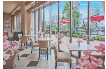
写真はイメージです

店内には桜の装飾を施し、空間全体で春の訪れを感じられる演出をご用意します。大きな窓の先には、みなとみらいの海を一望できる開放的なロケーションが広がり、4℃「SAKURA Collection」が表現する桜の世界観や、ブランドが大切にしている“水”のイメージとも美しく調和します。さらに春には、窓越しに望む汽車道に桜が咲き誇り、水辺と桜が織りなす、この季節ならではの景色をお楽しみいただけます。