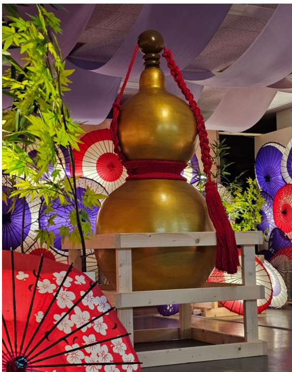
シンボルの 1.8m の巨大瓢箪 （天然ではありません）

株式会社レスト関ヶ原が運営する観光テーマパーク「関ヶ原グルメガーデン」内の関ヶ原合戦を再現したテーマパーク型資料館「関ヶ原ウォーランド」では、2024 年 12 月 20 日（土）から約 1,000 個の瓢箪（ひょうたん）を展示する季節企画「ひょうたん祭」を初開催します。瓢箪は古来より「子孫繁栄」「魔除け・開運招福」「無病息災（六瓢息災）」「三拍子揃う」などの象徴であり、縁起物とされています。来年の NHK の大河ドラマは「豊臣兄弟」ですが、豊臣秀吉は馬印に瓢箪を用いており、戦勝のたびに瓢箪を 1 つずつ増やして千にすると誓った「千成瓢箪」の故事が有名です。本イベントでは瓢箪を約 1,000 個展示し、これまで展示してきた和傘や竹ランタンとともに、和の風景を楽しんでいただけます。瓢箪の豆知識や、豊臣秀吉の千成瓢箪物語について学べるコーナーも用意しています。また、金運アップを祈願する金色の 1.8m の巨大瓢箪や、6 色に色分けした“6 つの瓢箪祈願所”で、新年の開運を祈願していただけます。