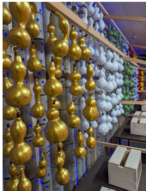
6 色に色分けした 6 つの瓢箪祈願所