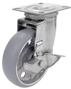
自在車ストッパー付