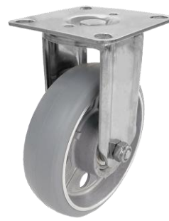
固定車 (自在車と同ピッチ)