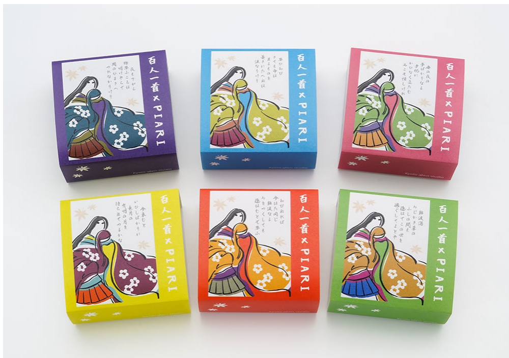
百人一首シリーズ限定パッケージ