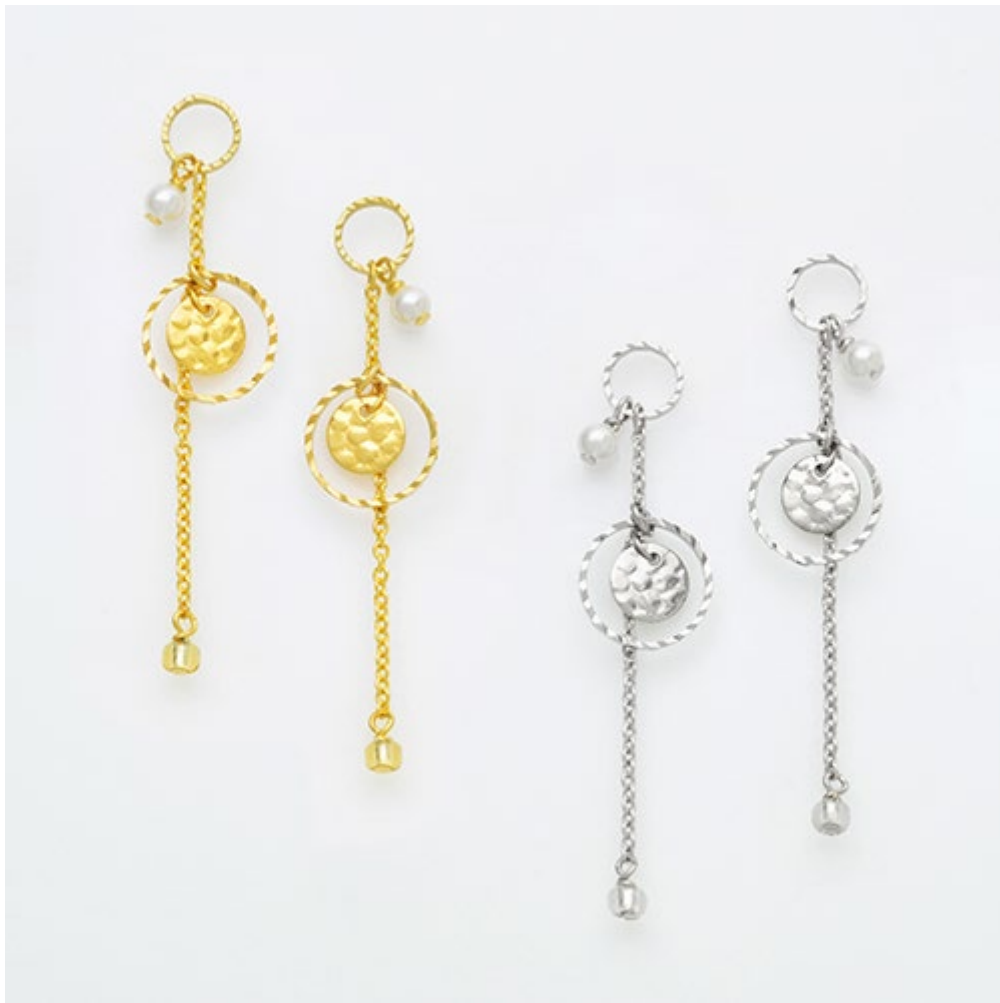
限定のカスタマイズチェーン「月ノ窓」