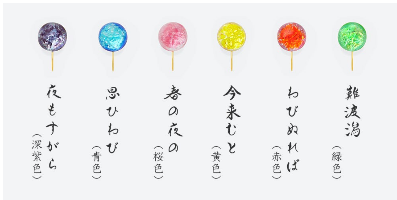
第 14 弾の 6 首

販売店：ジュエリー京都オンラインストア( https://jewelry-kyoto.jp/ )