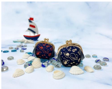
がま口小銭入 各 ¥2,640

クジラの親子が描かれたオリジナルの人気柄に、本POPUPショップ限定配色（紺革×赤漆）の商品が登場。コロっとした形が可愛いがま口やカードも収納できる小銭入や、パスケースなどプレゼントにもおすすめのアイテムです。