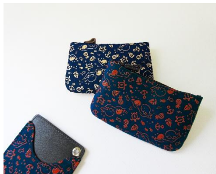
（画像左）パスケース ¥4,400 （画像右）小銭入 各 ¥3,080