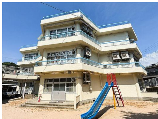
神戸市立塩屋小学校