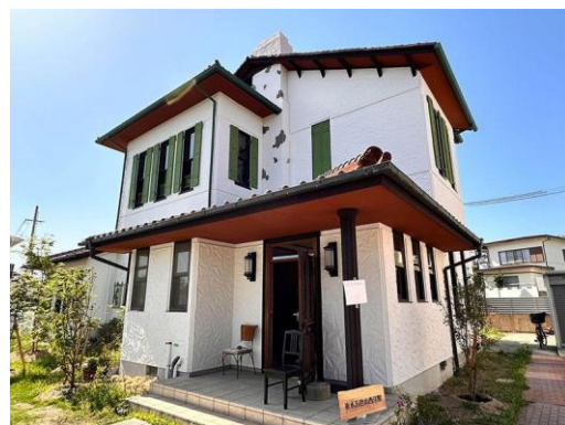
垂水五色山西洋館