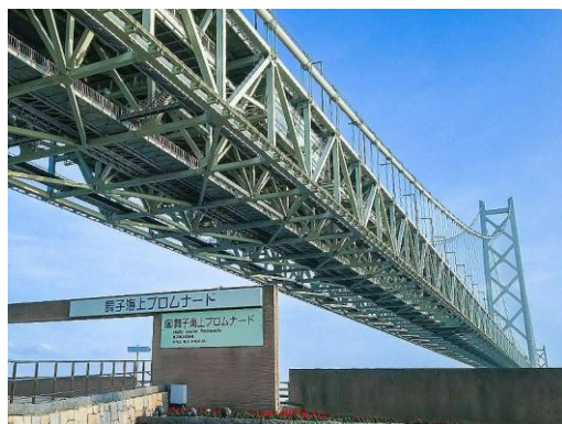
舞子海上プロムナード