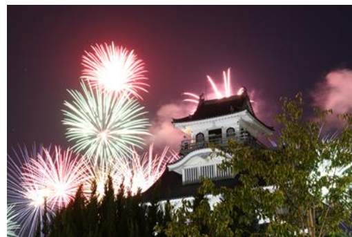
長浜城歴史博物館

滋賀県の湖北に位置する長浜市は、美しく豊かな自然環境に恵まれ、「戦国の聖地」、「観音の里」といわれるように多くの歴史的文化遺産を有しています。また、古くから渡来の文化や産業を受け入れる進取の気性と住民自治の心が息づき、自然の癒しと歴史浪漫あふれる環境のなか、住民主体で「やってみたい」ことに挑戦する風土が根づいており、リモートワーカーの誘致といった新しいはたらき方も推進しています。