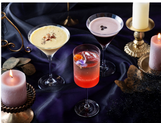
パンプキンヘッド、ダーティーテンブル、ビーカーブー※写真 左から