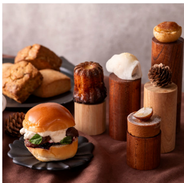
カヌレやスコーン、セイボリー