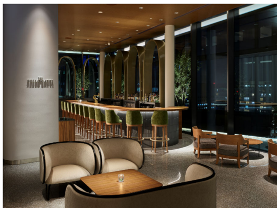
20階 BELLO GATTI (バー ベッロ ガッティ)