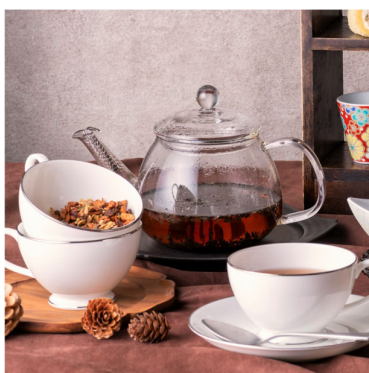
各種ドリンクはフリーフロー