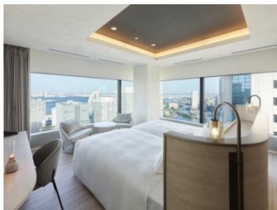
客室エグゼクティブコーナーツイン（46.1㎡）