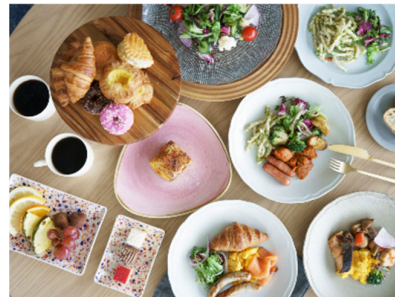
フレンチトーストはライブキッチンで出来立てを提供