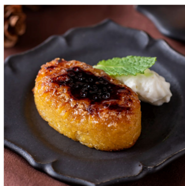
秋の代名詞 スイートポテト