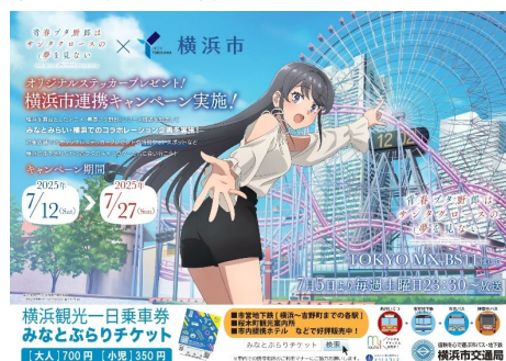
＜市営バス車内ポスターイメージ＞