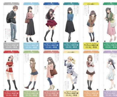
＜キャラクターのぼり＞

( https://www.yokohama-cu.ac.jp/access/ippan_kengaku_annai.html )