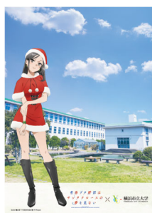
＜横浜市立大学と「青ブタ」コラボのオリジナルクリアファイルデザイン＞

裏面には、 大学マスコットキャラクター のヨッチーがいるよ。 絵柄はお楽しみに！