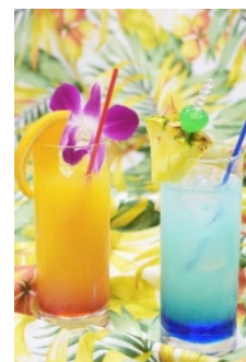
アルコールドリンク ※別途料金