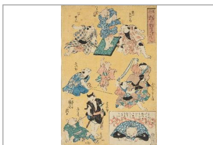
歌川国芳 《流行猫の狂言づくし [団七九郎兵衛ほか]》個人蔵