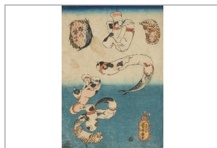
歌川国芳《猫の当字 かつを》個人蔵