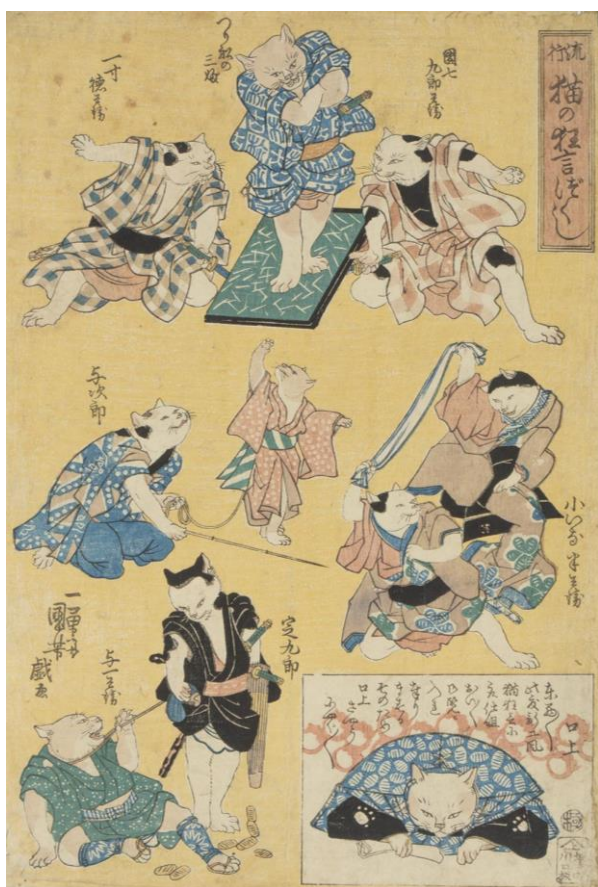
歌川国芳《流行猫の狂言づくし [団七郎兵衛ほか]》個人蔵

体を丸めたり毛づくろいをしたりと猫らしい仕草やにんまり笑った人間味ある表情、ちょっと怖い化け猫、擬人化されたユーモラスな猫…私たちを惹きつけてやまない奥深い猫の魅力をお楽しみください。