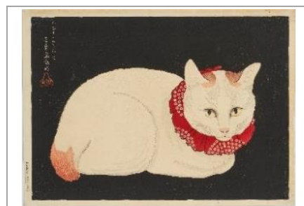
高橋弘明《[白猫]》個人蔵