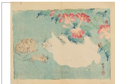
河鍋晩斎《晩斎楽画【猫と鼠】》個人蔵