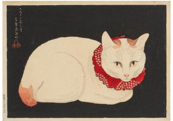
高橋弘明《〔白猫〕》個人蔵

歌川広重、歌川国芳など江戸時代に活躍した浮世絵師から、 歌川芳藤、高橋弘明ら江戸時代後期・明治時代に活躍した浮世 絵師まで、総勢 31 名による浮世絵版画をご紹介します。 絵師たちの個性あふれる猫の表現にご注目ください。