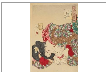
月岡芳年 《風俗三十二相 うるささう 寛政年間処女之風俗》個人蔵