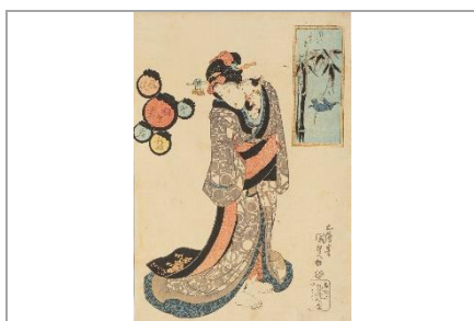
歌川国貞《新板風流相生尽 卯春 竹にすゝめ》 個人蔵