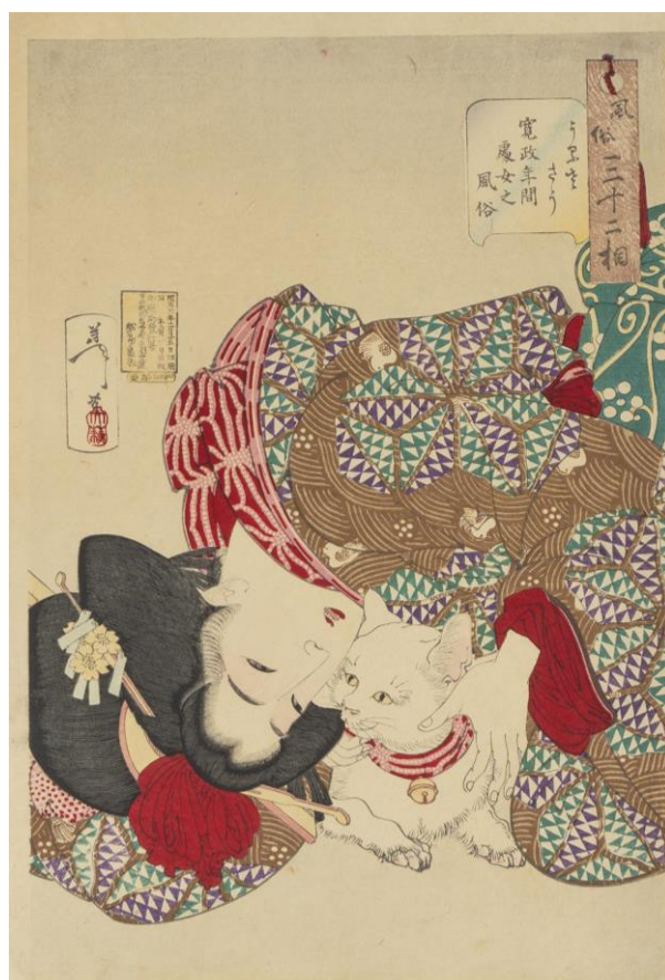
月岡芳年《風俗三十二相 うるささう 寛政年間処女之風俗》個人蔵