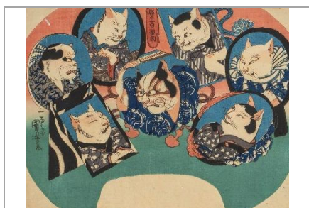
歌川国芳《猫の百面相 [またたび 荒獅子男之助ほか]》 渡邊木版美術画舗蔵