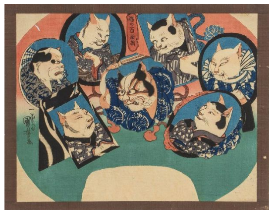
歌川国芳《猫の百面相〔またたび 荒獅子男之助ほか〕》渡邊木版美術画舗蔵