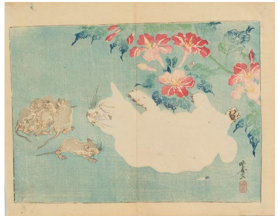
河鍋曉齋《曉齋楽画〔猫と鼠〕》個人蔵

浮世絵版画をとおして「猫」をひもとく展覧会です。 浮世絵版画に描かれる猫たちは、爪とぎをしたり、大きくのびをしたりと「猫らしい」姿を見せています。 人々が「猫らしい」と感じる仕草は鼠や虫など、小型の生き物を狩猟する野性的なハンターならではの習性の名残です。 それを魅力と捉えて描かれてきた絵画からは、猫の生き方や人との暮らしのあり方が見えてきます。