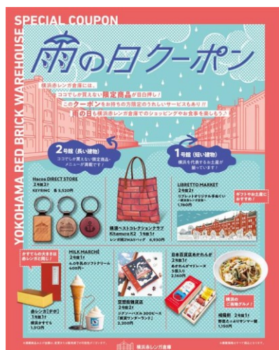
<「雨の日クーポン」イメージ>

横浜赤レンガ倉庫では、雨の日が増える 6 月から 7 月にかけて、天気がすぐれない雨の日でも横浜赤レンガ倉庫でのショッピングやお食事を存分にお楽しみいただきたいとの想いから、2025 年 6 月 21 日（土）から 7 月 21 日（月・祝）までの期間限定で「雨の日クーポン」キャンペーンを実施いたします。