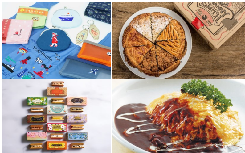
<対象店舗商品 一例>

本キャンペーンでは、前日 17 時時点で、気象庁 Web サイトにて発表された翌日の天気予報（神奈川県東部）に雨マークが付いていた場合のみ、翌日に横浜赤レンガ倉庫 2 号館インフォメーションカウンターにて「雨の日クーポン」が付いたチラシをプレゼント。チラシ裏面に掲載されている横浜赤レンガ倉庫 1 号館・2 号館の対象店舗（約 45 店舗）にて、店舗ごとの“お得な”サービスを受けることができます。詳細は以下に記載している「雨の日クーポン」キャンペーン概要欄をご覧ください。