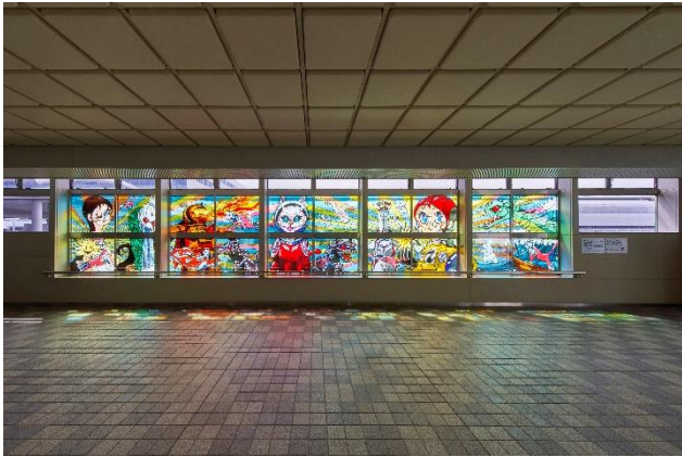
大型ステンドグラス「生命の旅」(大阪モノレール大阪空港駅改札口外)

大型ステンドグラス「生命の旅」は、2025年大阪・関西万博に向けた地域の活性化や賑わいをもたらす新たなシンボルとして、大阪モノレール大阪空港駅改札口外に2024年3月20日(水・祝)に設置されました。