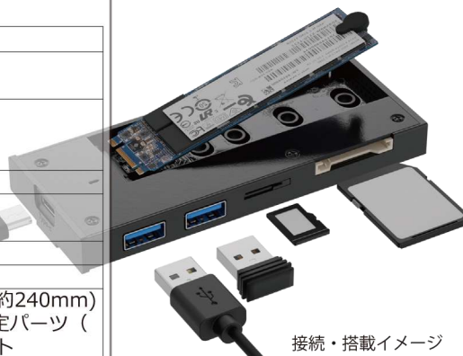
接続・搭載イメージ