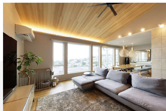
※画像は弊社施工事例につき、実際と異なります