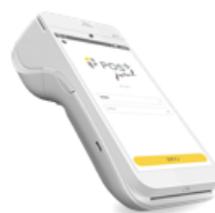
POSレジ (POS+) + キャッシュレス決済+レシートプリンターの機能を搭載

POS+のアプリを決済端末内にインストール シンプルな構成で省スペース化とレジの持ち運びが可能に