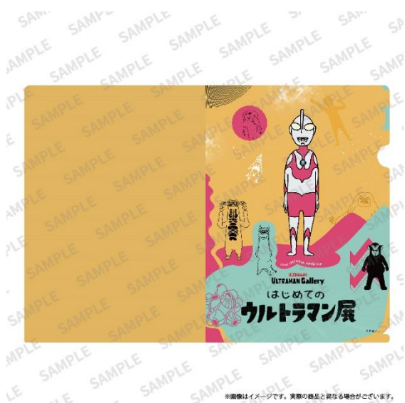
キービジュアルイラスト クリアファイル イメージ