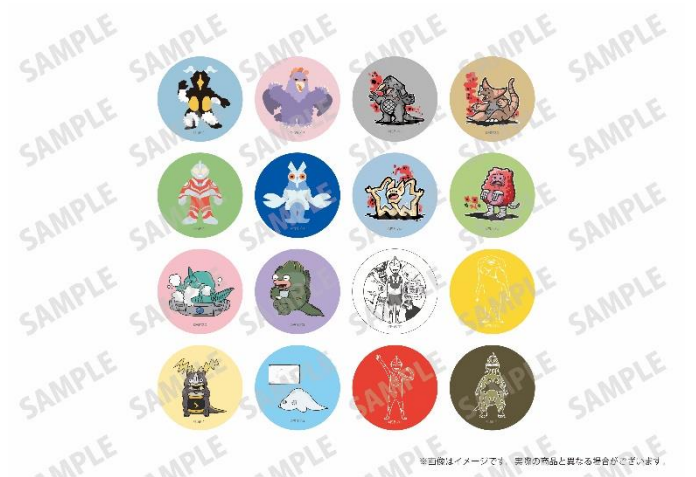
アート缶バッジ イメージ