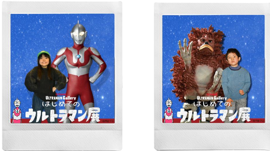
チェキ撮影会 イメージ