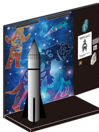
「シーボーズ」のフォトスポット イメージ