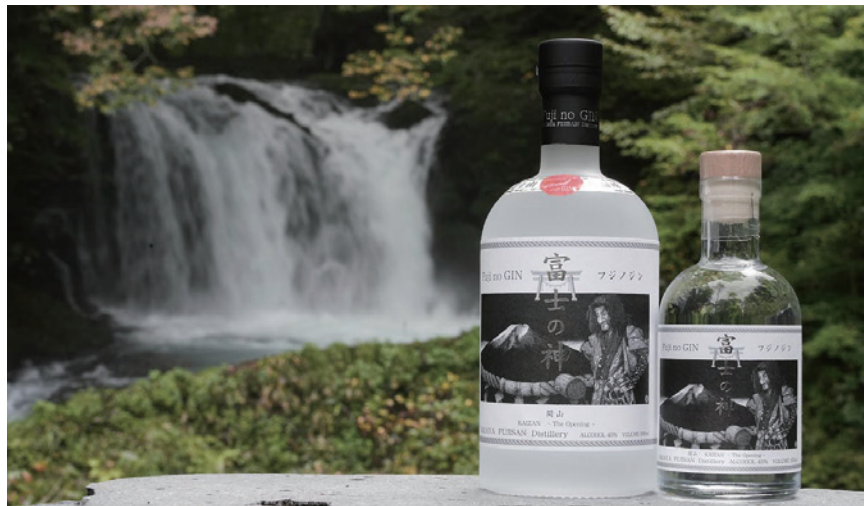
富士の神 開山 500ml（左）200ml（右）

直営店のなだや本店、道の駅富士吉田、富士山 5 号目観光売店、富士五湖周辺の土産物店等で販売を開始。