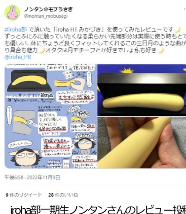
iroha部一期生ノンタンさんのレビュー投稿