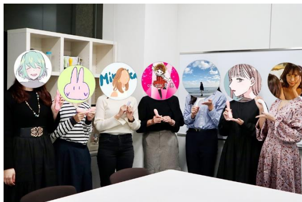
TENGA本社で開催された新商品の先行モニター座談会