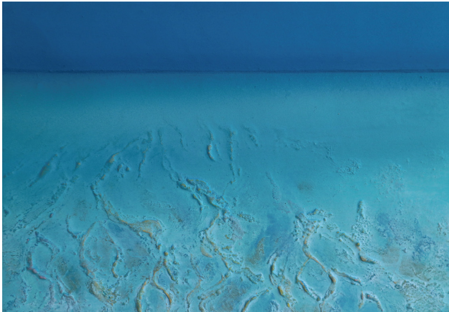
須恵 朋子 《ニライカナイを想うⅧ》