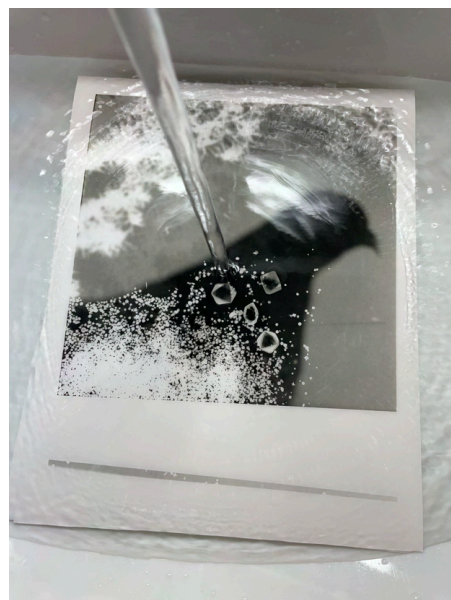
暗室で1枚の印画紙上に 写真を焼き付ける

SNS 【Twitter】@koyamahitoki 【Instagram】@koyamahitoki3 【WEB】 https://koyamahitoki.tumblr.com