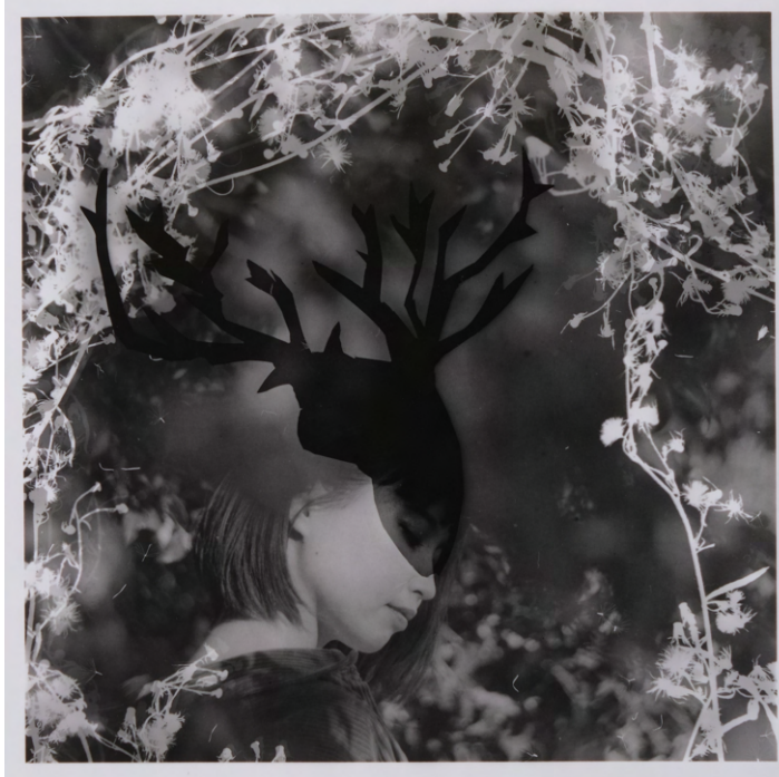
Crystal Photographs#2-1 森の住人