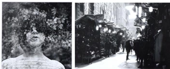
多重露光ポートレートとスナップ