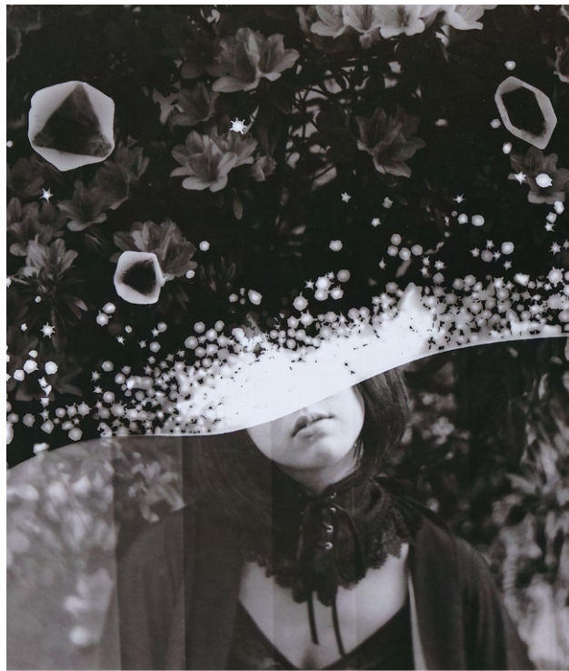
『Crystal Photographs#5-1』 2022, Gelatin silver print, RC paper

Hitoki Koyama - Solo Exhibition - 2023.1.8 sun-21 sat