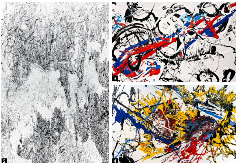
1. 《Replacement#26》2022 年 116x116cm (部分) 2. 《Landslide BW#1》3. 《Replacement#14_BBR》4. 《Replacement#25》