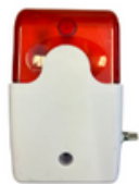
LEDブザー……1 音量調整可能(非防水)タイプ or 音量調整不可(防水)タイプ