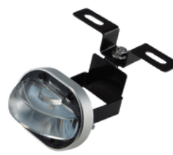
LEDレーザーダウンライト