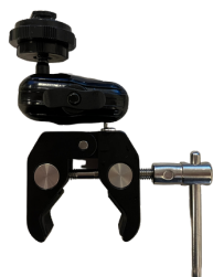
モニタークランプ 取付用ブラケット