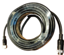
延長ケーブル各種 3m・5m・10m・15m・20m