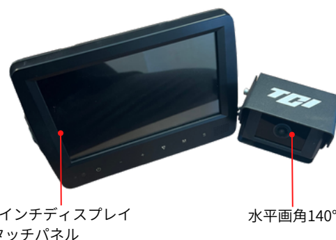
7インチディスプレイ タッチパネル