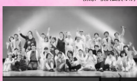
劇団桜座 (東京・横浜公演のみ) 劇団「横浜桜座」は「障がいがあってもなくても表現することで輝く為」という目的で結成された演劇集団です。