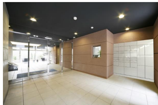
マンション内に設置された フルタイムロッカー

※1：個人間取引を提供するオークション、フリマサイト・アプリの中での個人間取引で利用可能なネコポスの最安。2021 年 8 月 25 日時点。（ヤフーが一部を負担します。）