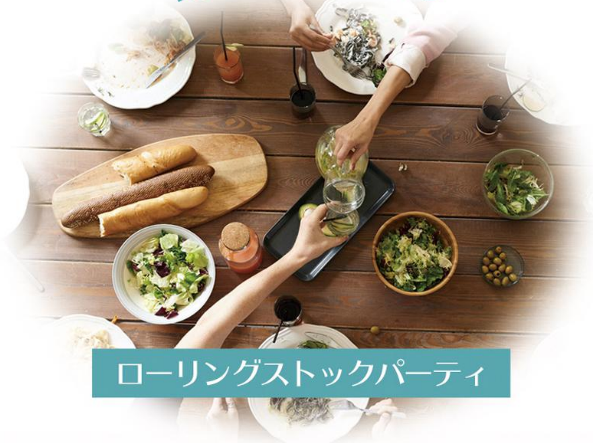
ローリングストックパーティ