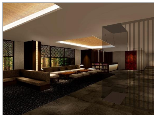
ロビー内ラウンジ部分イメージ

付帯施設 ・レストラン＝1 店舗 (1F、朝食提供 7:00～10:00、51 席) ・男女別大浴場 (1F)