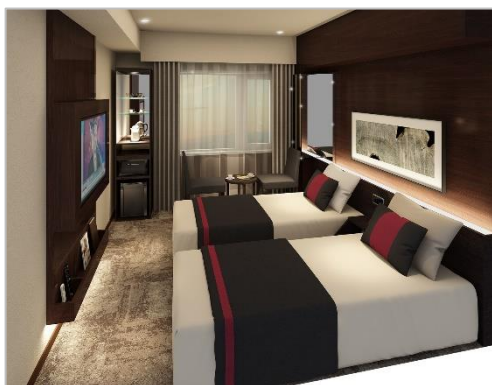
客室完成予想図(スタンダードツイン、19 m 2 )

*消費税・サービス料込、宿泊税別 *開業記念プラン料金(宿泊期間:2019 年 6 月 1 日～7 月 31 日)