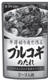
(ダイショー プルコギのたれ)