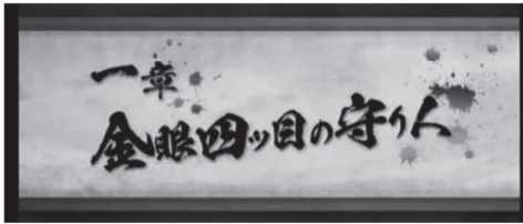
(コーエーテクモゲームス 討鬼伝)