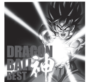
(ドラゴンボール神BEST CDジャケット)