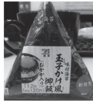
(セブンイレブン おにぎり)