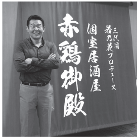
(花乃花プロデュース 居酒屋 赤鷲御殿)