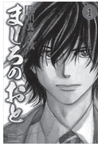
(藤川真重茂 ましろのおと タイトル文字)