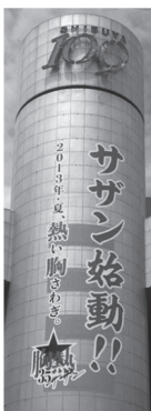
(渋谷 109 広告 サゼン始動)