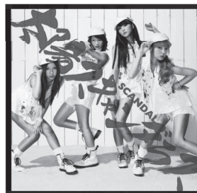
(SCANDAL 太陽スキャンダラスCDジャケット)