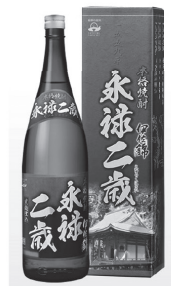
(大口酒造 永禄二歳)