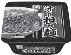
(マルちゃん 汁なし担々麺)