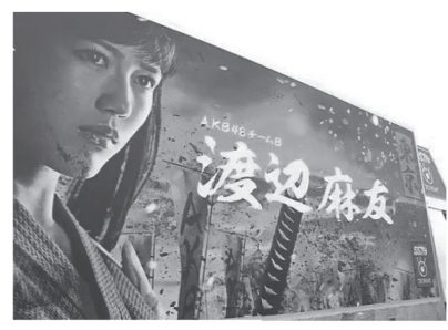
(AKB総選挙 アドトラック文字)