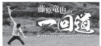
(テレビ番組 藤原竜也の一回道)