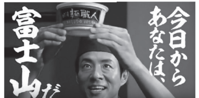
(日清食品 日清麺職人C刊)