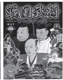
(ディアゴスティーニ 週刊 戦国武将データファイル)