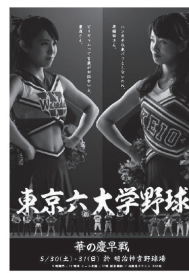
(東京六大学野球ポスター)