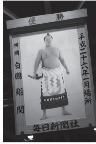
(毎日新聞社 大相撲優勝額)