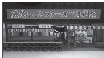
(とんこつラーメン 一蘭 店舗文字)