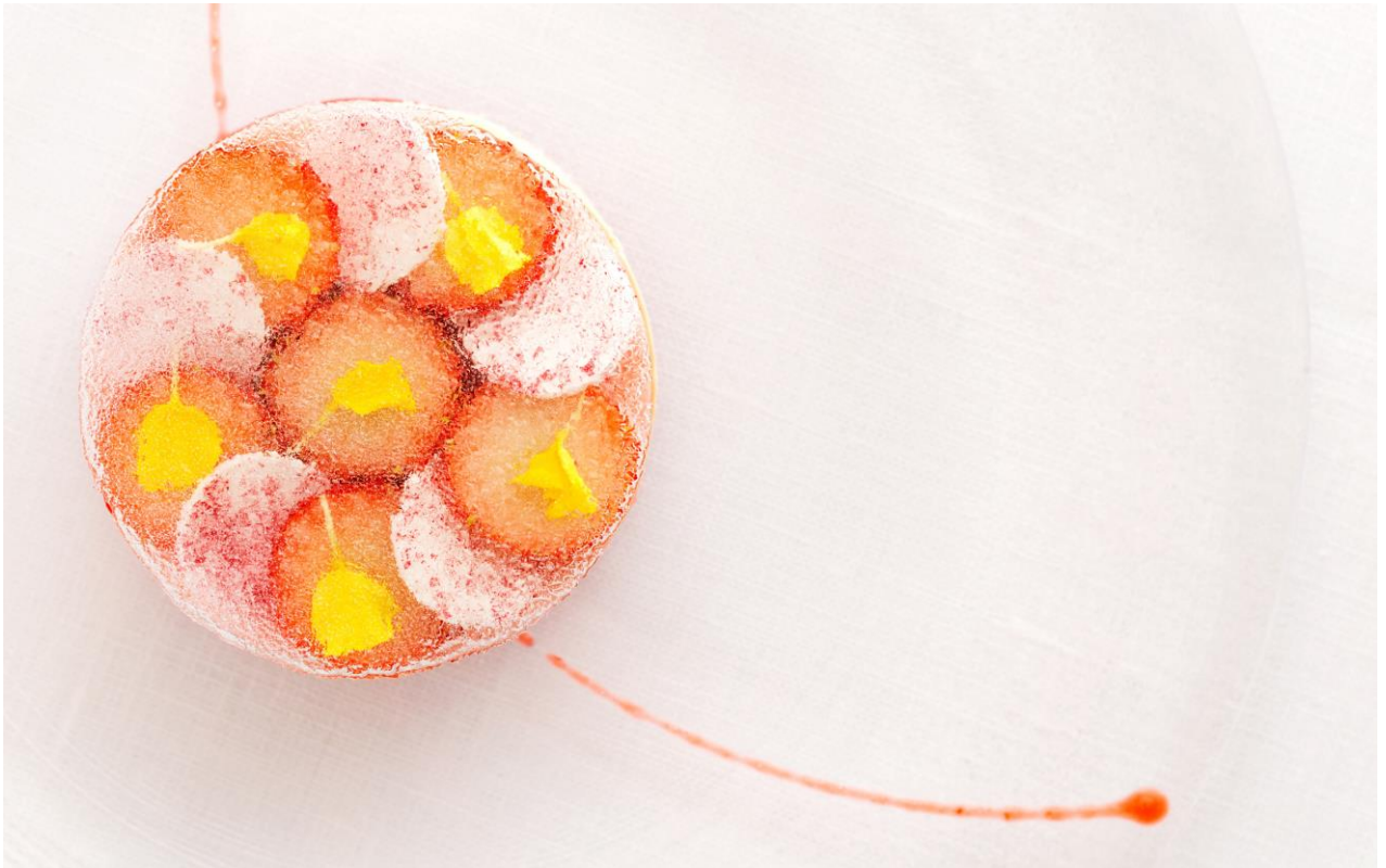
メインのひとつ：花の便り

美食のホテル「星野リゾート 軽井沢ホテルブレストンコート」は、「春の便りのデザートコース」を、2018年3月23日～4月8日の毎週金・土・日曜日に提供します。フランス料理のフルコースに見立てた、前菜・スープ・メイン・ミニャルディーズの全4品を、苺を使ったデザートで構成します。旬の苺をバリエーション豊かに味わえるデザートコースです。