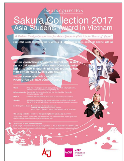
▲ASIAN STUDENTS AWARDS in Vietnam ポスター

◆本件に関するお問い合わせ SAKURA COLLECTION 2017-2018 実行委員会事務局