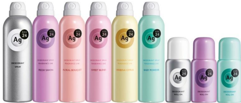
左より、資生堂 パウダースプレー h、資生堂 パウダースプレー h（SV）、資生堂 パウダースプレー h（FB）、資生堂 パウダースプレー h（SW）、資生堂 パウダースプレー h（VC）、資生堂 パウダースプレー h（BP）、資生堂 デオドラントロールオン、資生堂 デオドラントロールオン（SV）、資生堂 デオドラントロールオン（BP）

2016年2月にリニューアルした「エージーデオ24」は、高いデオドラント機能と肌ケアに着目。「24時間、いつでもどこでも肌快適ケア」をコンセプトにしています。