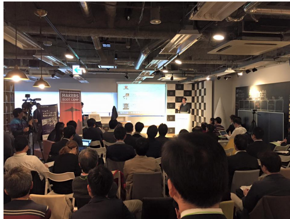
第1回「Makers Boot Camp Autumn 2015」デモデイの様子(2015年12月)