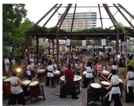
▼いちょう坂ステージ 開催イメージ