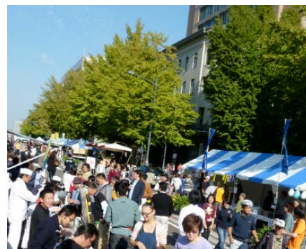
▲歩行者天国 開催イメージ