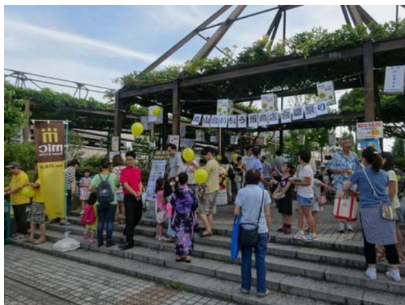
2014年7月に駅前にて開催した「夏祭り」

商店会の新愛称公募、情報誌「いちちょう坂手帖」発行し「年末大抽選会」を開催。その結果、今春には若手会員が商店会を盛り上げようと団結し「夏祭り」を実施。さらなる商店会活性を目指し、このたび商店街のメインストリートにて歩行者天国イベントを企画。