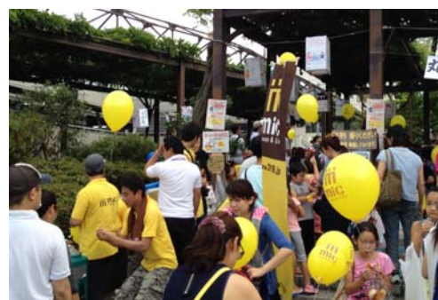
「夏祭り」の運営協力