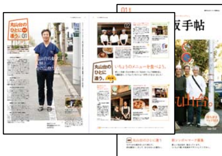
商店街ガイドマップ発行