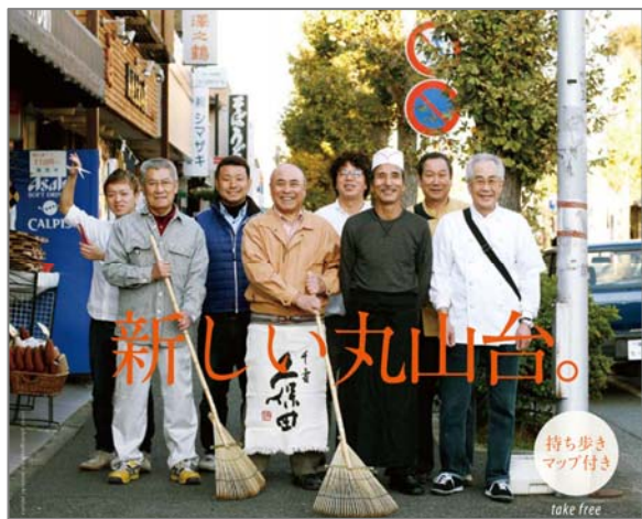
▲ 商店会ガイドマップ「いちょう坂手帖」 (制作：[ミック] 三春情報センター)