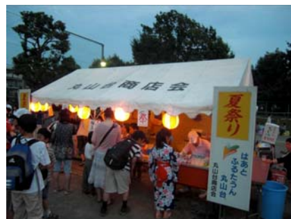
自治会夏祭りに参加