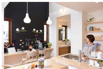
コミュニケーションキッチン・ファミリーウオール