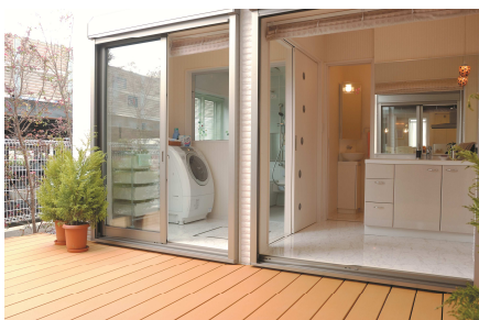
ランドリーテラス