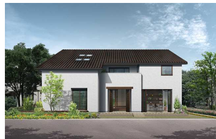
宇都宮インターパーク展示場