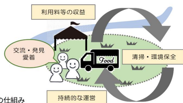
MFBの公益還元と持続的運営の仕組み